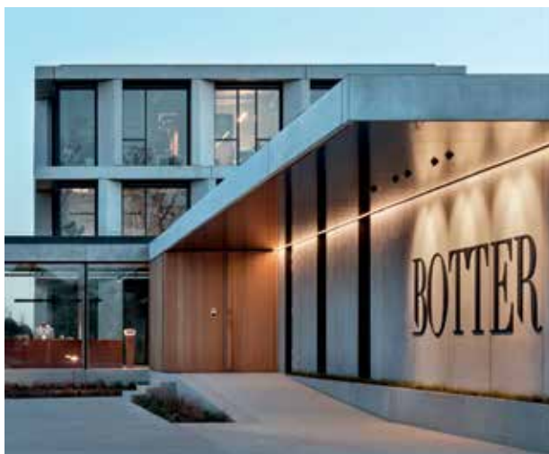
Botter Fossalta di Piave