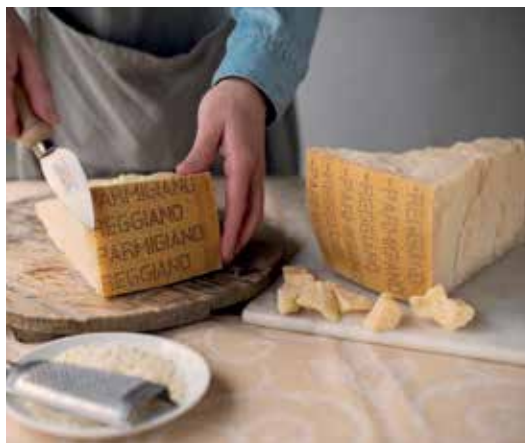
Parmigiano Reggiano Dop