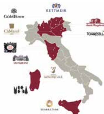
Il mosaico enologico di Santa Margherita Gruppo Vinicolo