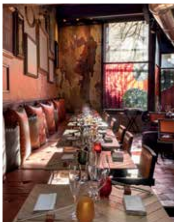
Gran Baguttin, Milano