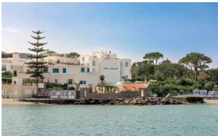
Punta Molino Beach Resort & Thermal Spa, Ischia