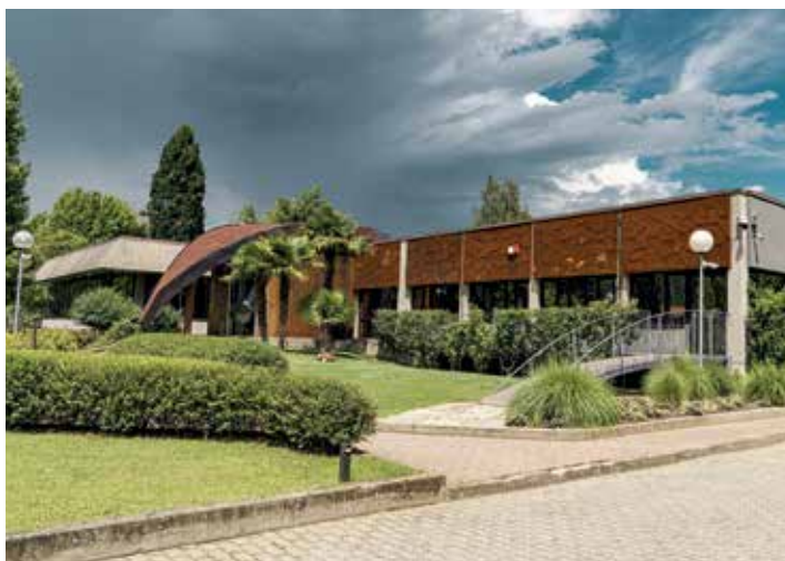
Headquarter a Colleretto