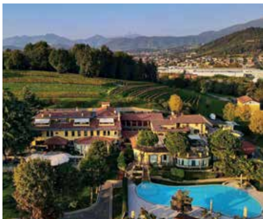
Da Vittorio, collina della Cantalupa