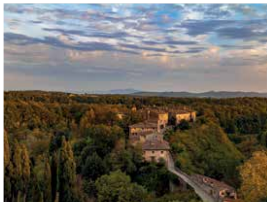
Il Borro Relais & Chateaux