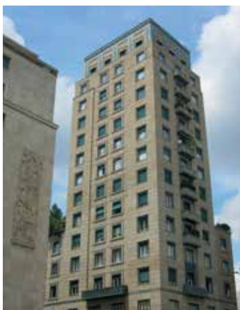
'Torre Snia Viscosa', sede di Pambianco in Corso Matteotti 11 a Milano

Entrato nel 2000 nella società fondata da Carlo Pambianco, è stato coinvolto negli ultimi vent'anni in oltre 100 progetti di consulenza e M&A. Ricopre, inoltre, il ruolo di managing partner in Made in Italy Fund, il fondo di Quadrivio & Pambianco specializzato negli investimenti nelle Pmi del made in Italy ad alto potenziale di crescita.