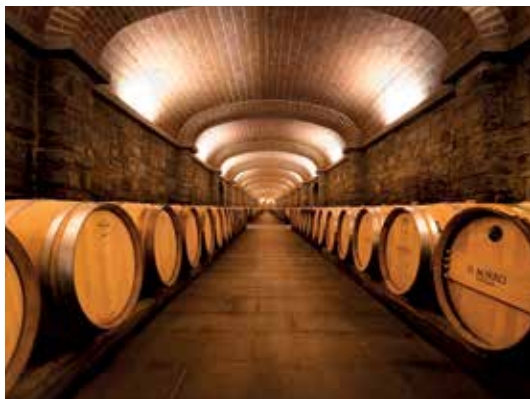
La Cantina del Borro