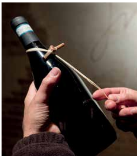
Cantina Zaccagnini Tralcetto