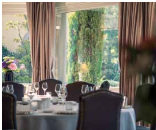
Da Vittorio, interno ristorante