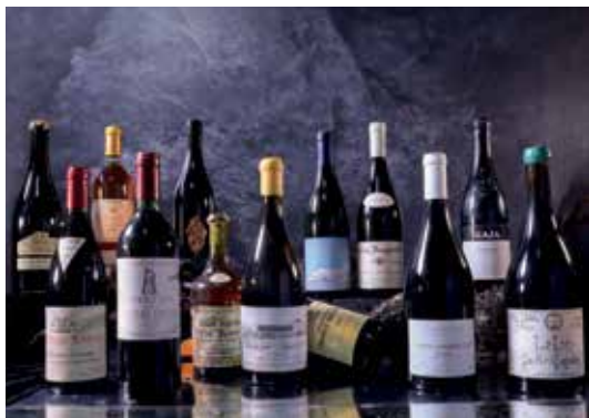
Alcuni Top Producers battuti all'asta nel 2022