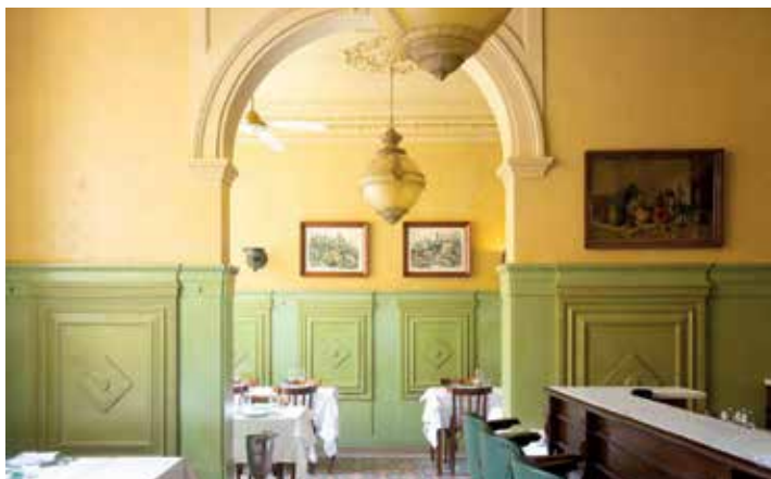
Da Giacomo Milano