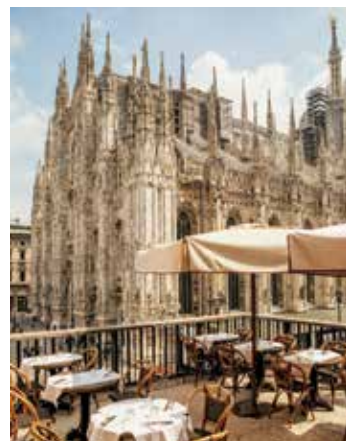
Da Giacomo Arengario