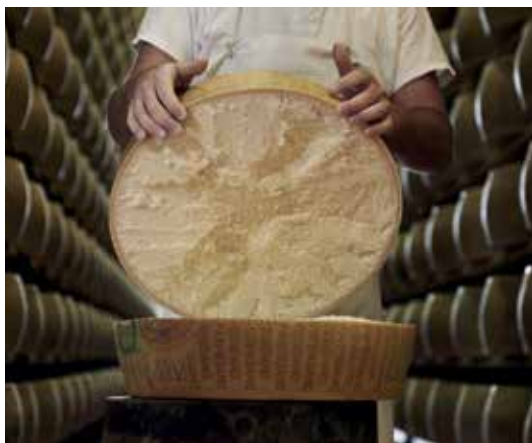
Apertura della forma di Parmigiano Reggiano