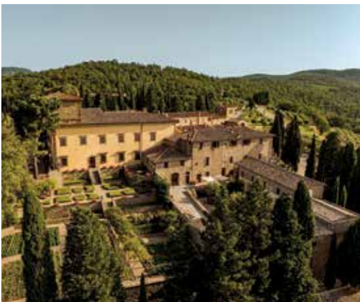
Castello di Albola