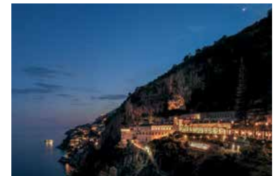
Anantara Convento di Amalfi Grand Hotel