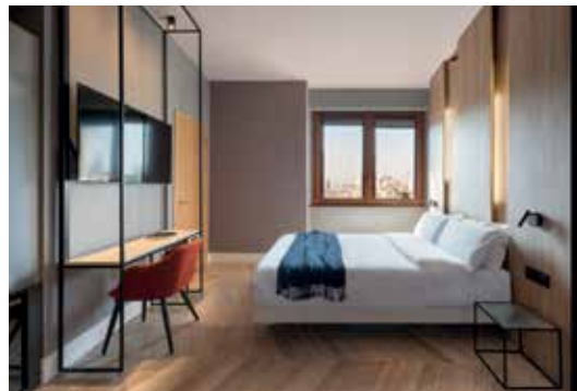
B&B HOTEL Milano City Center Duomo