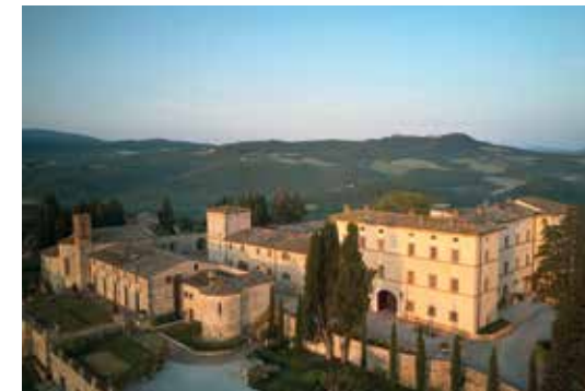
Panoramica esterno di Castello di Casole, A Belmond Hotel, Tuscany