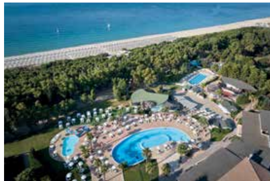
Serenè Resort - Calabria