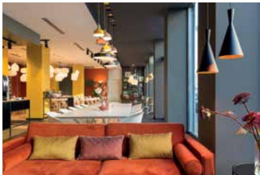
B&B HOTEL Milano Central Station