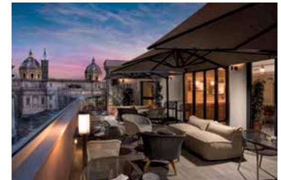
DoubleTree by Hilton Rome Monti - Mùn Rooftop Bar