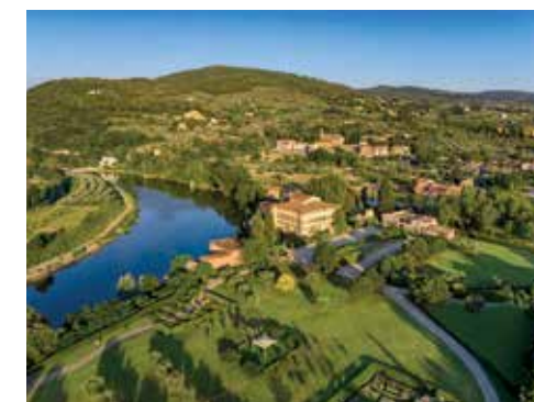
Villa La Massa