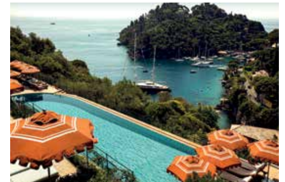
Vista su Portofino dallo Splendido, A Belmond Hotel, Portofino