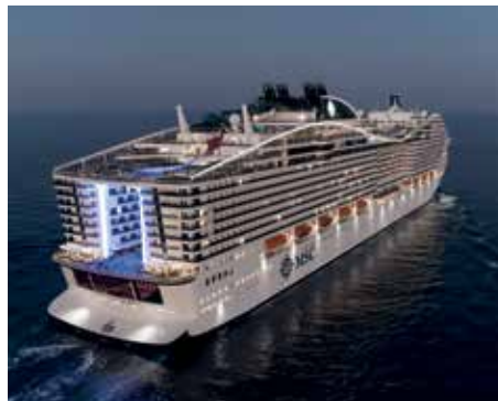
MSC World Europa