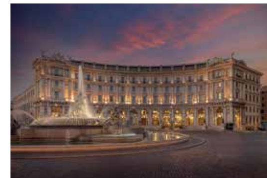
Anantara Palazzo Naiadi Rome Hotel