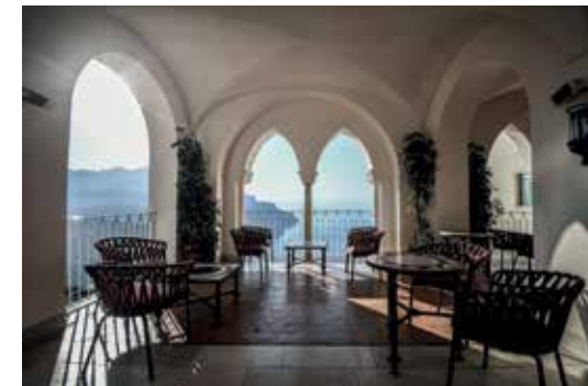
Vista mozzafiato dal Bar Caruso presso Caruso, A Belmond Hotel, Amalfi Coast

Il portfolio vanta icone dell'ospitalità: Hotel Cipriani a Venezia e Hotel Caruso a Ravello - entrambi nella Gold List di Condé Nast Traveller - Hotel Splendido a Portofino, La Residencia a Maiorca, Reid's Palace a Madeira.