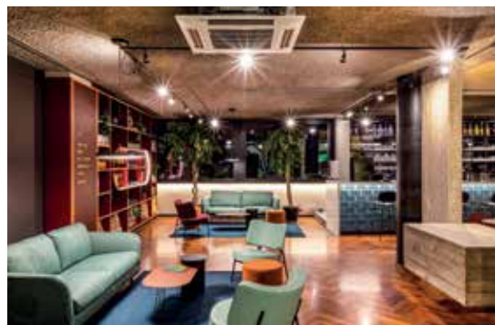
Ibis Styles Roma Aurelia