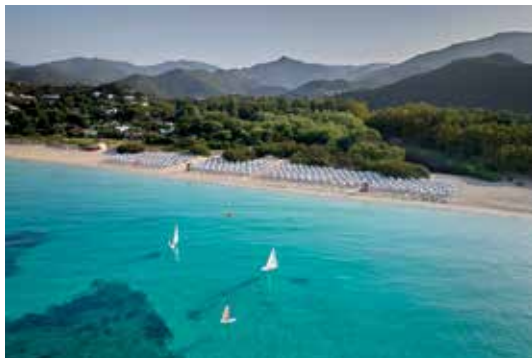
Calaserena Resort - Sardegna