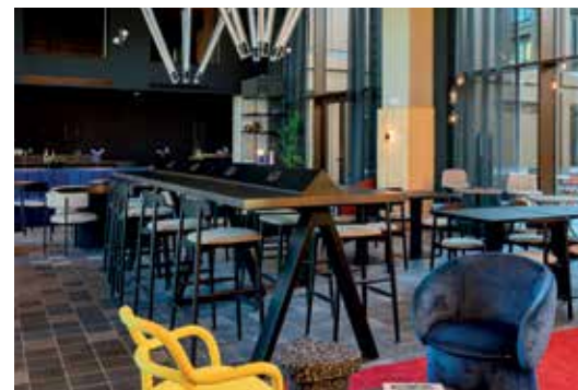
Tribe Milano Malpensa