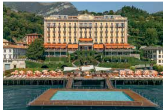
Grand Hotel Tremezzo