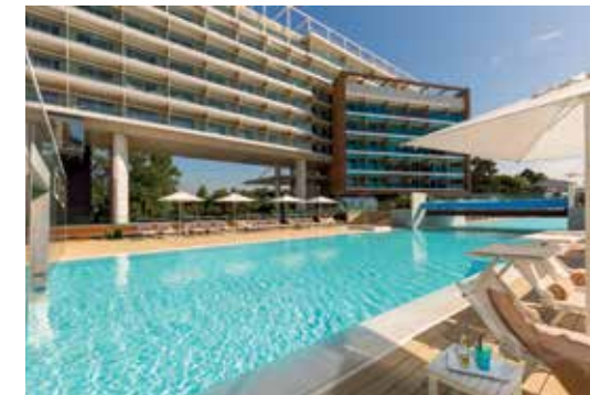
Almar Jesolo Resort & Spa - Outdoor pool